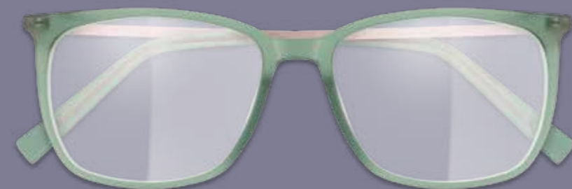
FERN- ODER NAHBRILLE inkl. Gläser* ab 89€ GLEITSICHTBRILLE inkl. Gläser** ab 179€