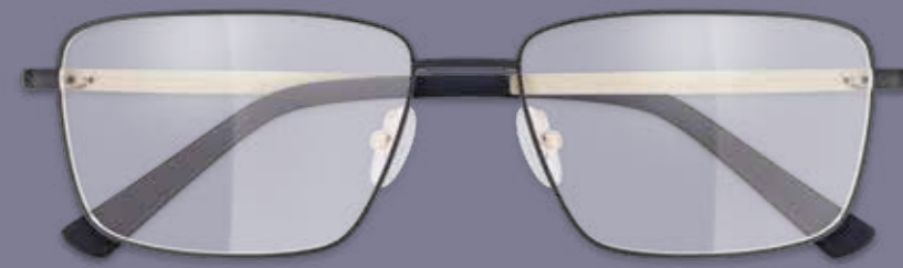
FERN- ODER NAHBRILLE inkl. Gläser* ab 119€ GLEITSICHTBRILLE inkl. Gläser** ab 209€