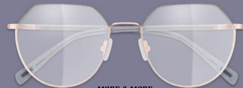
MORE & MORE FERN- ODER NAHBRILLE inkl. Gläser* ab 149€ GLEITSICHTBRILLE inkl. Gläser** ab 239€