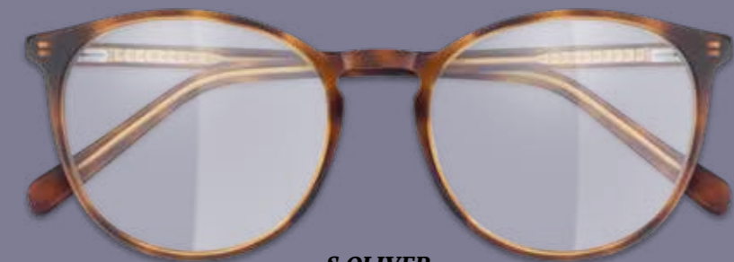
S.OLIVER FERN- ODER NAHBRILLE inkl. Gläser* ab 149€ GLEITSICHTBRILLE inkl. Gläser** ab 239€