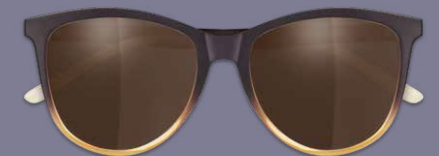
SONNENBRILLE inkl. Einstärkengläser* ab 89€ SONNENBRILLE inkl. Gleitsichtgläser** ab 179€