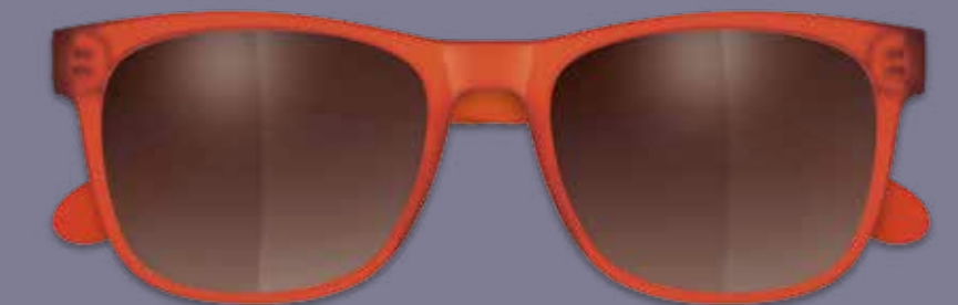
SONNENBRILLE inkl. Einstärkengläser* ab 89€ SONNENBRILLE inkl. Gleitsichtgläser** ab 179€